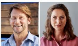
Milieu der Adaptiv-Pragmatischen Mitte Der flexible und nutzenorientierte Mainstream