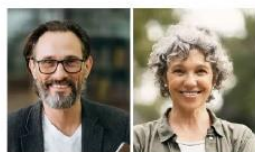
Postmaterielles Milieu Die weltoffenen Kritiker:innen von Gesellschaft und Zeitgeist