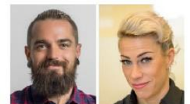
Hedonistisches Milieu Die momentbezogene, erlebnishungrige (untere) Mitte