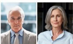
Konservativ-Etabliertes Milieu Die alte strukturkonservative Elite