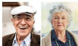
Traditionelles Milieu Die Sicherheit und Ordnung liebende ältere Generation