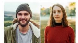
Progressiv-Realistisches Milieu Die Treiber gesellschaftlicher Veränderungen