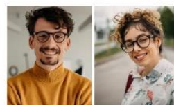
Kosmopolitisch-Individualistisches Milieu Die individualistische Lifestyle-Avantgarde