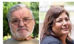
Milieu der Konsumorientierten Basis Die um Orientierung und Teilhabe bemühte Unterschicht