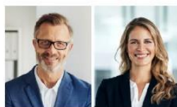
Milieu der Performer Die global orientierte und fortschrittsoptimistische moderne Elite