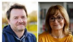
Nostalgisch-Bürgerliches Milieu Die systemkritische ehemalige Mitte